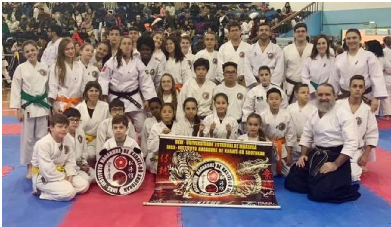
A delegação da UEM: 35 Atletas e 13 Equipes.