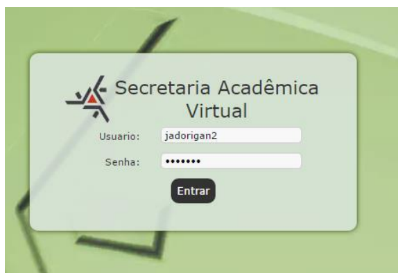
Figura 1: Login de Usuário

É necessário que o professor efetue o login , utilizando seu nome de usuário sem o “@uem.br” (somente as primeiras letras de cada nome mais o sobrenome completo – caso seja professor colaborador (temporário) acrescente o número 2 ao final, ex: jadorigan2 ) e a sua senha institucional. A Figura 1 apresenta parte da tela de login da SAV.